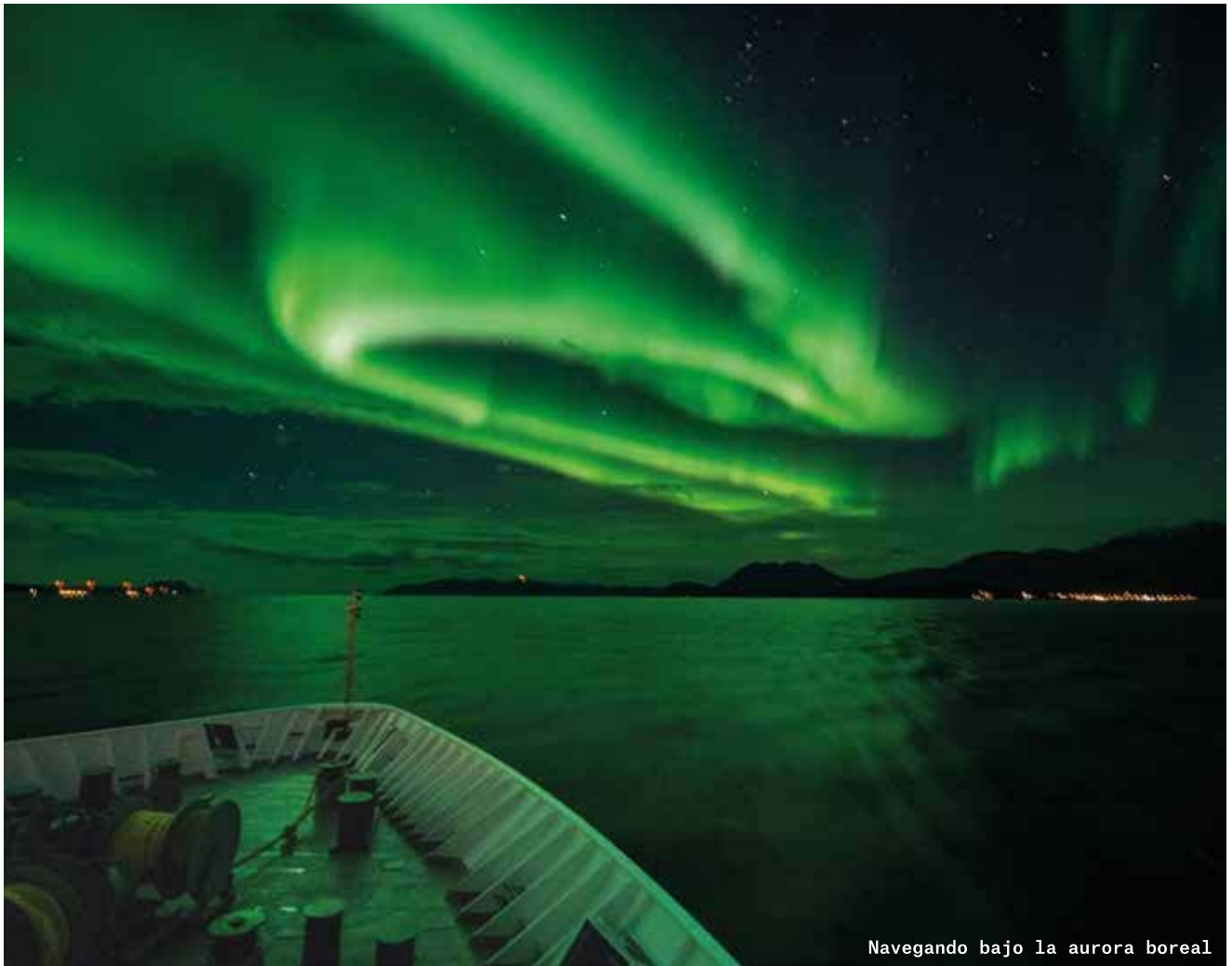
Navegando bajo la aurora boreal