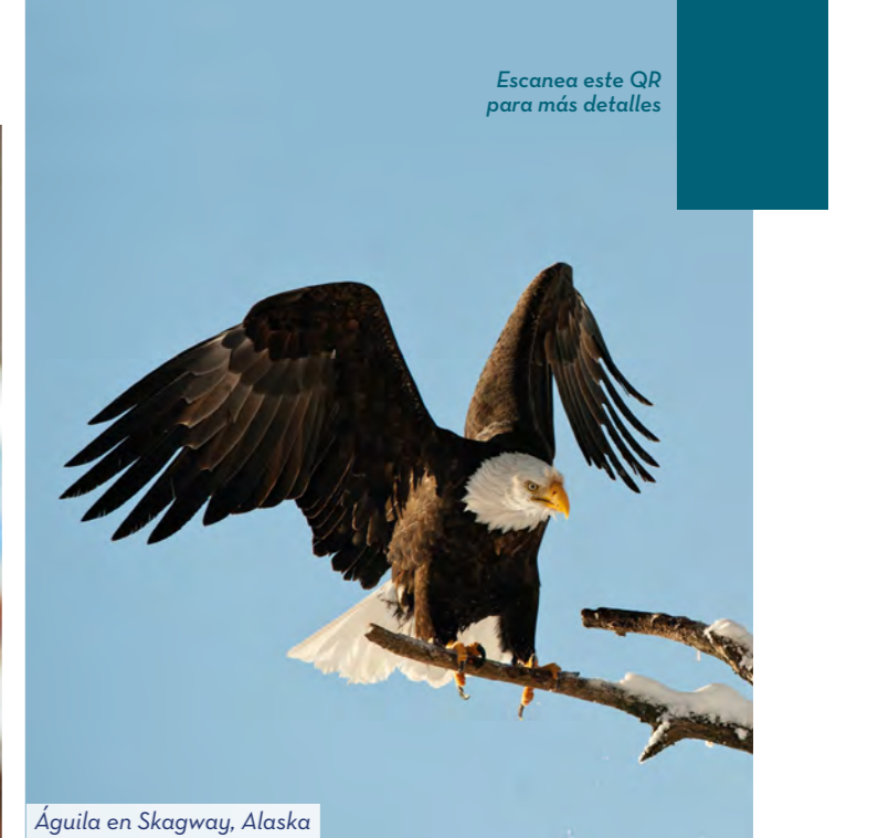
Águila en Skagway, Alaska