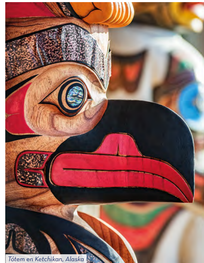
Tótem en Ketchikan, Alaska