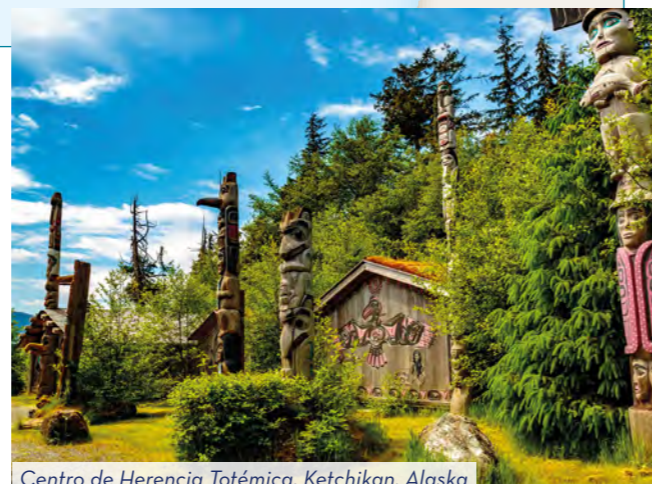
Centro de Herencia Totémica, Ketchikan, Alaska