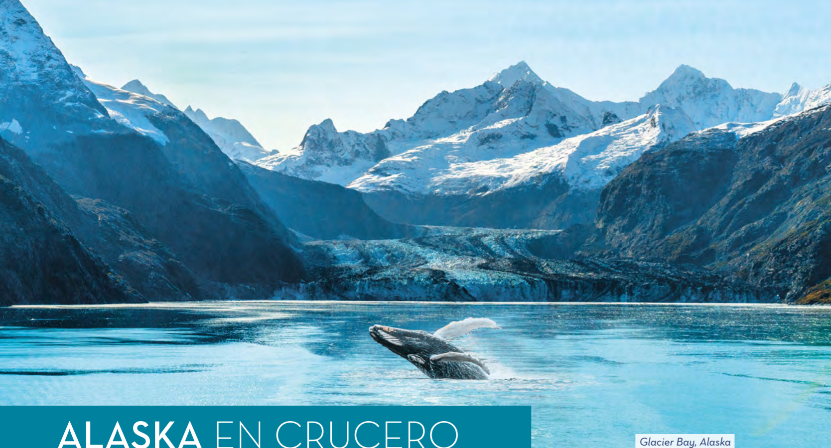
Glacier Bay, Alaska